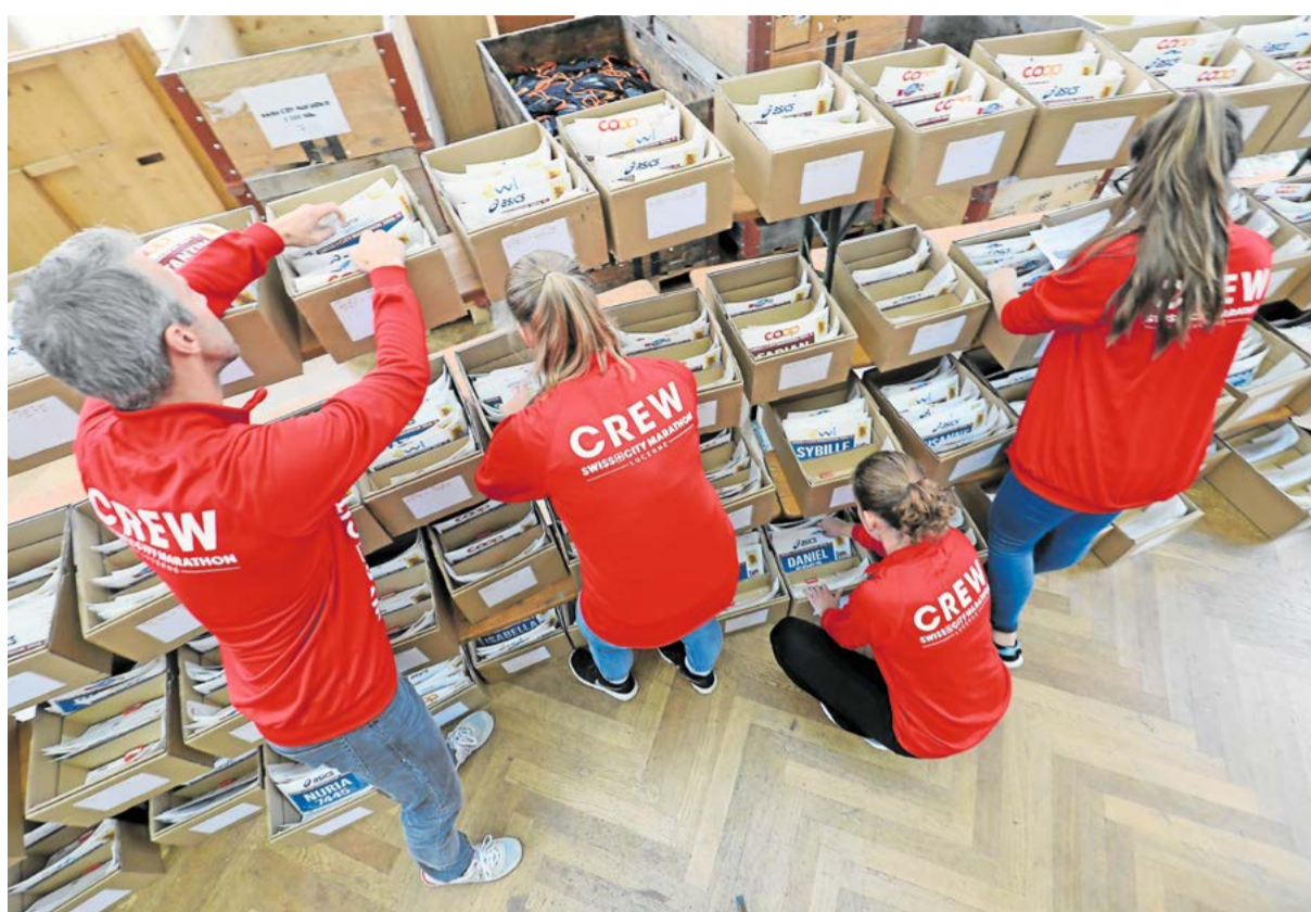
Le comparatif permet aux jeunes de comprendre leur profil et de trouver un métier plus facilement. Quant aux entreprises, elles peuvent mieux cerner un profil avant de définir un poste ou d'engager un apprenti. Construisez votre team!

Les conseillères et conseillers en orientation professionnelle donnent aux jeunes qui cherchent un métier une image réaliste des exigences posées par les professions qu'ils souhaitent apprendre. Les profils d'exigences représentent à ce sujet un outil important. Ils aident en effet les jeunes qui cherchent une profession à comparer les exigences du métier avec leurs propres capacités et intérêts.